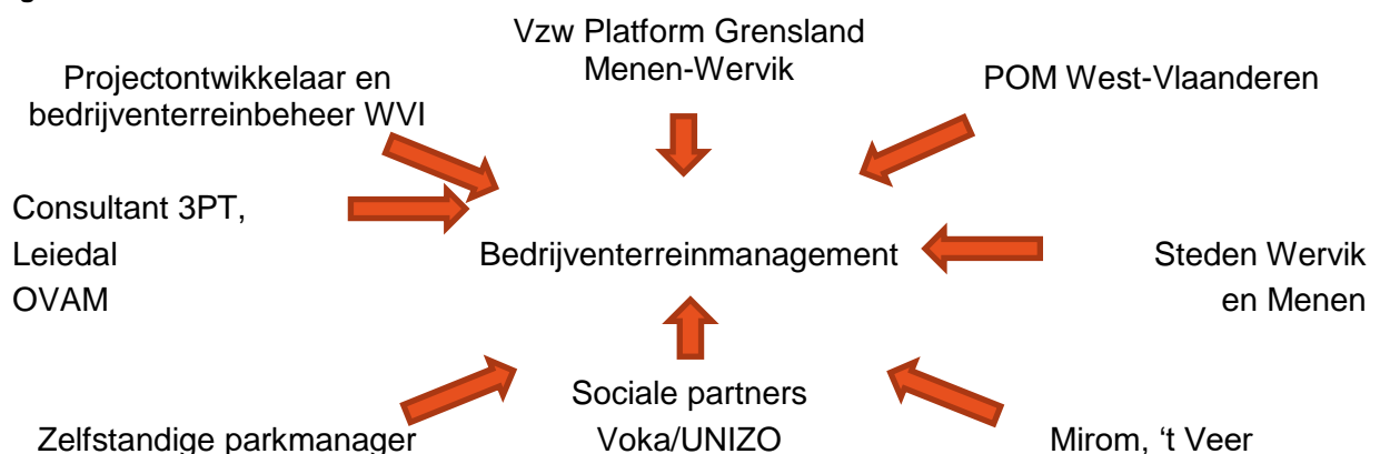
Figuur 3 Betrokkenen vzw Platform Grensland Menen-Wervik

De projectontwikkelaar is WVI en ook bedrijventerreinbeheerder. Het bedrijventerrein Grensland Menen-Wervik doet voor praktische ondersteuning, het veiligheidsbeleid en de beeldkwaliteit van het bedrijventerrein, een beroep op de bedrijventerreinbeheerder WVI en ook de expertise van Leiedal kan ingeroepen worden. Belangrijk pluspunt hierbij is dat gebruik kan gemaakt worden