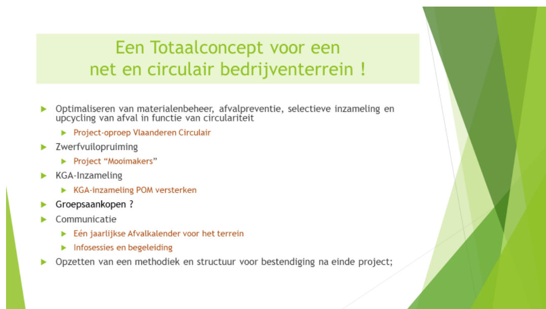
Figuur 4 Illustratie Grensland is Circulair (presentatie 3PT consult)

Op het bedrijventerrein zijn er productiebedrijven, afvalophalers en -verwerkers, logistieke bedrijven, een afvalintercommunale en een maatwerkbedrijf met interesse in het project.